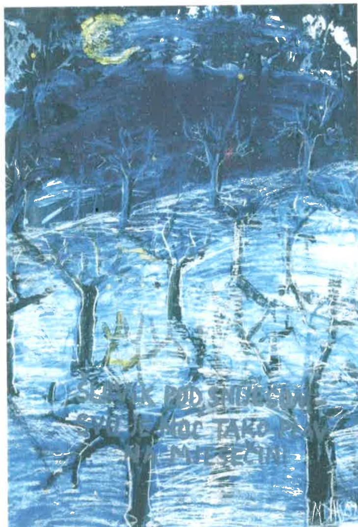
Mirjana Drempetić Hanžić

za sudjelovanje na 10. HAIKU DANU – DUBRAVKO IVANČAN KRAPINA 2008.